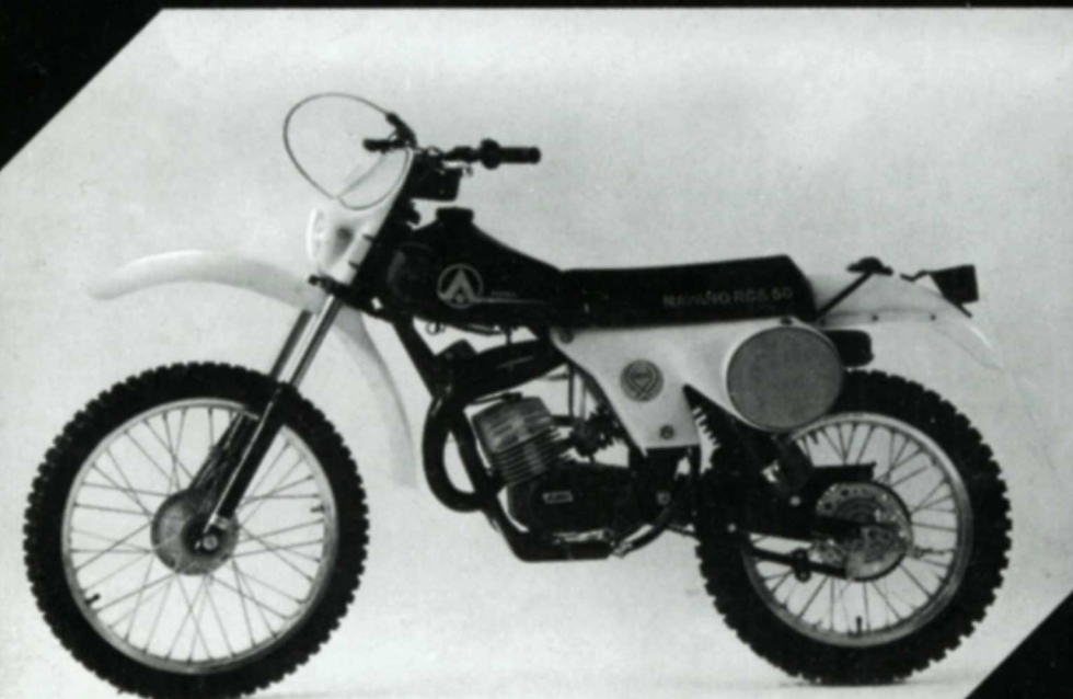
Navaho GS-Mokick RCM 50 50 ccm / 3,0 PS