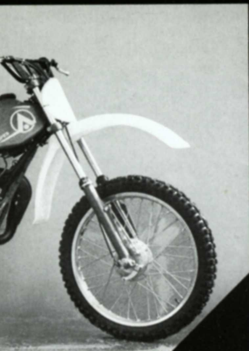
Luft 50-80 ccm / 13 und 15 PS