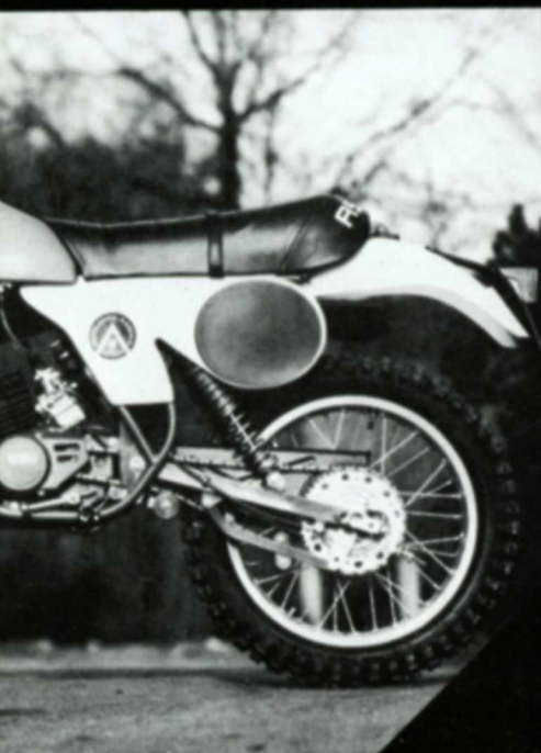
0 ccm / 8 PS