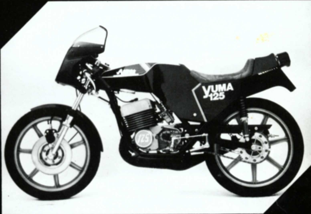
Juma 125 / 125 TT 125 ccm / 14-19-25 PS

Holen Sie sich die neuesten Informationen auf dem IFMA-Stand oder nach der Messe bei uns in Ulm.