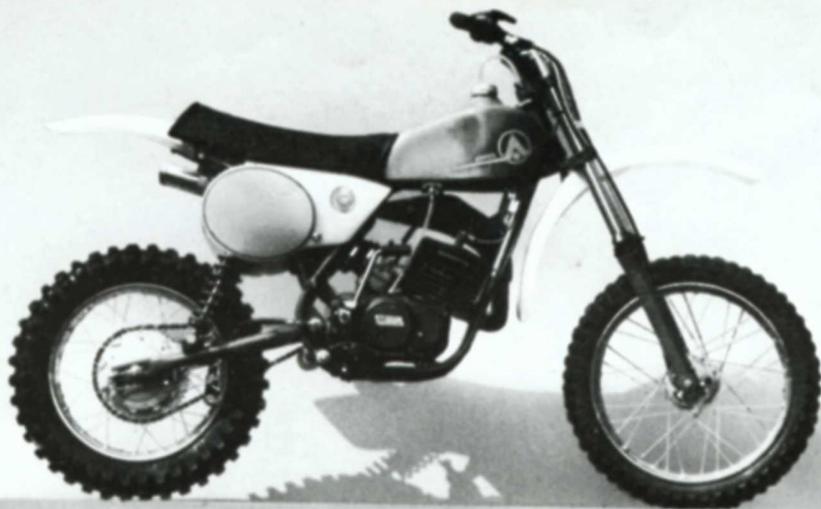
Junior Cross TX 50/MX 50/MX 80 50-80 ccm / 4-15 PS