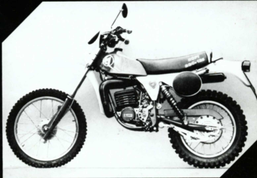
Hopi RGCR 125 GS / Wettbewerb 125 ccm / 14-21-24 PS