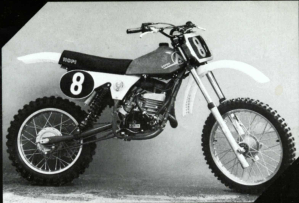
Hopi Cross CRC 125 Luft und Wasser 125 ccm / 27 und 30 PS