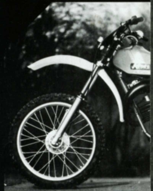
Navaho GS-Leichtkraftrad RCL 80 80 ccm / 10 PS