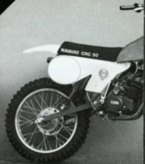
Navaho Cross CRC 50 Wasser/CRC 80