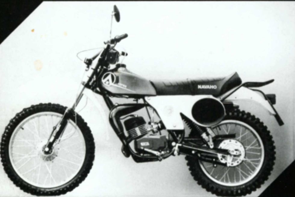
Navaho GS-Mokick RCR 50 Standard und Spezial 50 ccm / 1,5-7 PS