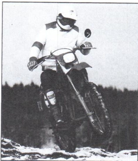
Rechts: HRD RPE 80 Competition, sehr geländegängig, ab Mitte dieses Jahres mit Casal-Motor. Unten: Yamaha DT 80 LC, die ausgereifteste Enduro mit dem Fahrwerk der 125er und einem starken Motor

Fazit aus PS 1/84: „Trotz der erwähnten Mängel (Motor mit falscher Übersetzung, sparsame Ausstattung) ist die HRD ein gelungenes Leichtkraft- rad für leichtes und schweres Gelände. Auf der Straße fühlt sie sich nicht so zuhause.“