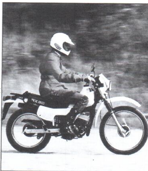
Oben: Suzuki TS 80 X mit modernem Triebwerk und Mono- shock-Fahrwerk. Gute Fahrleistungen und gelungene Optik. Links: Zündapp SX 80 als gelungener Kompromiß zwischen Straßen- und Enduro- Leichtkraft- rad